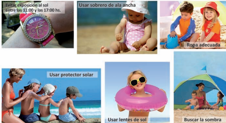
Figura 4. Recomendaciones para la fotoexposición.