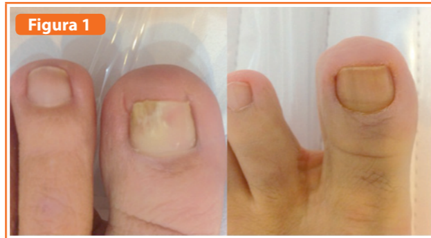
Figura 1 Onicomiosis tratada con 3 sesiones de láser fraccionado CO 2 y ciclopiroxolamina al 8% por 3 meses. Fotos pretratamiento y a los 6 meses.

útiles para aclarar la eficacia, los mecanismos, los regímenes óptimos y las indicaciones para aplicar correctamente la tecnología en el tratamiento de la onicomiosis (15,16) .