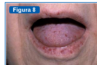
Figura 8 Telangiectasias. En pacientes con patología hepática aparecen mayoritariamente en mucosa oral y lengua, así como también en piel de cara y cuello. Los «puntos rubies» se observan en pacientes con insuficiencia hepática (típicos de cirrosis), telangiectasias puntiformes sin ramificaciones (11) .

Existen circunstancias vinculadas con el sistema endócrino que en un