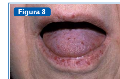
Figura 8 Telangiectasias. En pacientes con patología hepática aparecen mayoritariamente en mucosa oral y lengua, así como también en piel de cara y cuello. Los «puntos rubies» se observan en pacientes con insuficiencia hepática (típicos de cirrosis), telangiectasias puntiformes sin ramificaciones (11) .

Existen circunstancias vinculadas con el sistema endócrino que en un