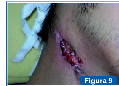
Figura 9 Tuberculosis en glándula parótida. Usualmente se limita a los nódulos linfáticos intra o extraparotídeos. Puede conducir a una escrófula con apertura en piel de cuello y formación de fístulas.