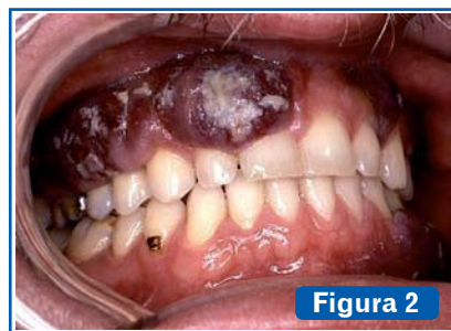
Figura 2 Sarcoma de Kaposi. Neoplasia maligna más frecuente en pacientes con SIDA. La mucosa bucal se ve afectada entre el 40% y el 90% de los casos.

El centro de colaboración para el estudio de las manifestaciones