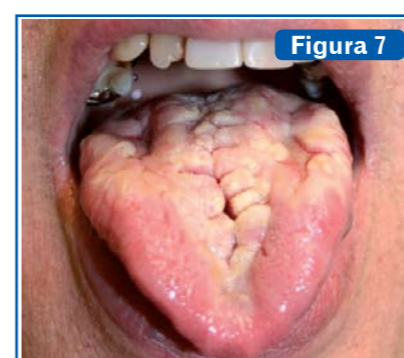
Figura 7 Lengua geográfica. También llamada glositis migratoria benigna o glositis exfoliativa. Se aprecian placas de color rojo, lisas, brillantes, con un epitelio adelgazado, las cuales no llegan a ulcerarse, sin papilas filiformes y en las que se destacan las papilas fungiformes, limitadas por una queratosis circundante sobre elevada de color blanco-amarillento (6) .

la C tiene muchos rasgos en común con ella.