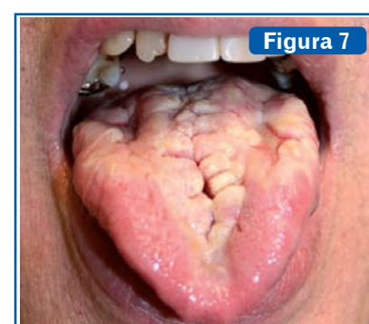
Figura 7 Lengua geográfica. También llamada glositis migratoria benigna o glositis exfoliativa. Se aprecian placas de color rojo, lisas, brillantes, con un epitelio adelgazado, las cuales no llegan a ulcerarse, sin papilas filiformes y en las que se destacan las papilas fungiformes, limitadas por una queratosis circundante sobre elevada de color blanco-amarillento (6) .

la C tiene muchos rasgos en común con ella.