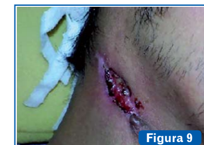
Figura 9 Tuberculosis en glándula parótida. Usualmente se limita a los nódulos linfáticos intra o extraparotídeos. Puede conducir a una escrófula con apertura en piel de cuello y formación de fístulas.