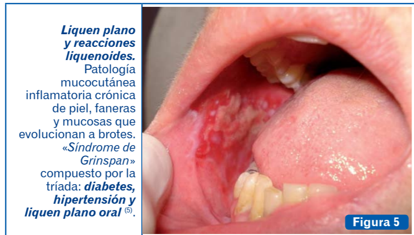
Figura 5 Liquen plano y reacciones liquenoides. Patología mucocutánea inflamatoria crónica de piel, faneras y mucosas que evolucionan a brotes. «Síndrome de Grinspan» compuesto por la tríada: diabetes, hipertensión y liquen plano oral (5) .

La hepatitis B parece tener la mayor repercusión odontológica, aunque