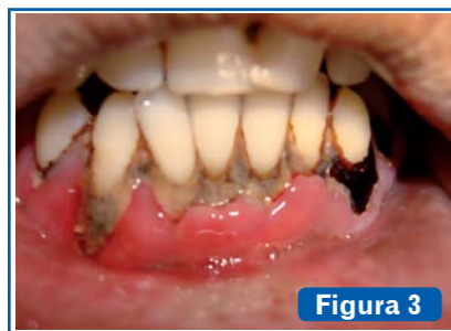
Figura 3 Periodontitis úlcero-necrotizante aguda. Necrosis de tejidos blandos y rápida destrucción de los tejidos duros periodontales. Dolor. Sangrado espontáneo.