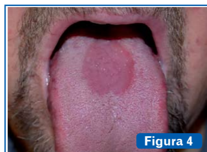
Figura 4 Glositis romboidal media. Área de atrofia de las papilas linguales, de forma elíptica o romboidal, simétricamente situada y centrada con respecto a la línea media en el dorso lingual.

orales de la infección por VIH de la Organización Mundial de la Salud (OMS) clasifica a las lesiones en 3 grupos de acuerdo al grado de asociación que guardan con la infección por VIH (3) . (Ver Tablas 1, 2 y 3 y Figuras 1, 2 y 3).