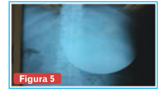
Figura 5 Post operatorio inmediato de Gastrectomía. Radiología de Vaciamiento gástrico retardado (paresia gástrica) importante