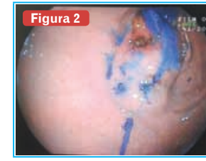
Figura 2 Tumor con tinción con colorante por Endoscopia.