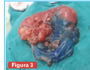
Figura 3 Pieza Quirúrgica con tumoración antral y distribución del colorante por tercio superior de cuerpo y fundus gástrico