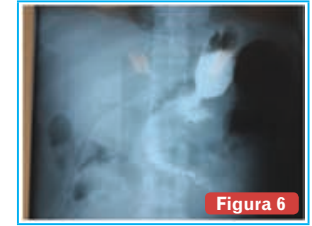
Figura 6 Recuperación de vaciamiento gástrico retardado tratado con suspensión de ingesta por vía oral, procinéticos gástricos y sonda nasoyeyunal para nutrición.

casos por millón de habitantes, teniendo una prevalencia mayor, debido al curso clínico largo de la enfermedad (10-15 años) (3,4) .